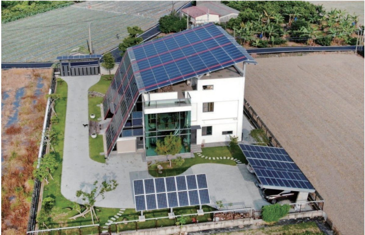
沅碁光電總經理鄭博文打造自家成為環保節能屋。